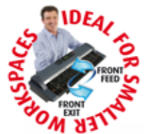
SmartLF Ci24 (m/c/e モデル)

SmartLF Ci40 は CIS ベースのスキャナで、原稿幅 40 インチ (1016mm) に対応し、A0 サイズまでの図面、地図などの原稿をモノクロ、グレースケール、またはカラーでのスキャンを可能にします。新機種 Ci24 は Ci40 を小型化したモデルで A1 サイズまでの原稿に対応します。両機種ともお求めやすい価格で導入ができ、さらに高いパフォーマンスを提供します。CCD ベースの SmartLF